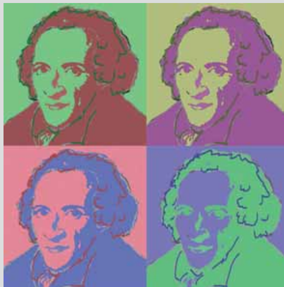
HOMMAGE

Das Programm des ersten Moses-Mendelssohn-Symposiums in Berlin ist inspiriert von den Lebensthemen des Aufklärungs-Philosophen, der bei seinen Zeitgenossen in ganz Europa als „der Jude von Berlin“ bekannt war. In seiner berühmten Stammbuch-Eintragung „Bestimmung des Menschen. Wahrheit suchen, Schönheit lieben, Gutes wollen, das Beste tun“ hatte dieser Emanzipationspionier seine Vorstellung von der conditio humana formuliert. Die Tagungsvorträge über das Lebenswerk, das Menschenbild und die Rezeption Mendelssohns korrespondieren mit der Untersuchung jener zahlreichen, unterschiedlichen Portraits, die von ihm – dem bis zu Einstein am häufigsten abgebildeten Juden – bereits zu Lebzeiten entstanden waren. So bereitet das interdisziplinäre Symposium auch eine Moses Mendelssohn-Ausstellung vor, die voraussichtlich 2020 im Jüdischen Museum Berlin stattfinden soll.